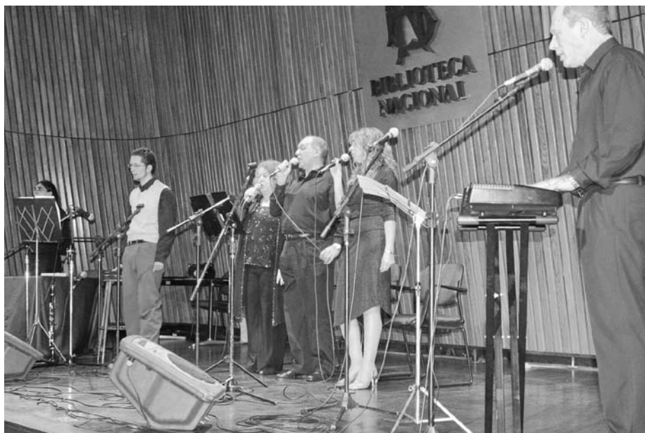
Tzu zinguen un tzu zogn. Para cantar y decir - Recorrido musical de Buenos Aires Ídsh