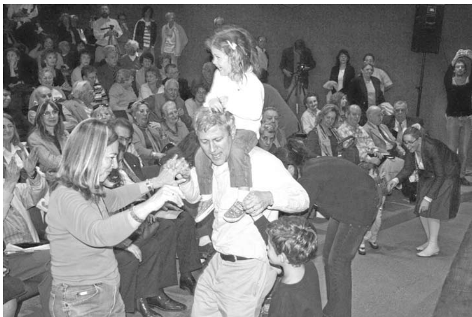
Bailando en la Biblioteca Nacional