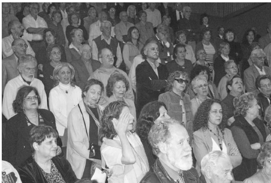
El público entona emocionado el Himno de los Partizanos